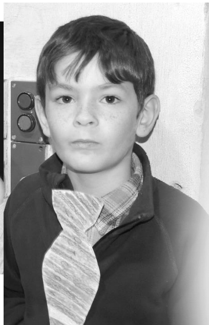
ANDERSENOVA NOC 2012/2013