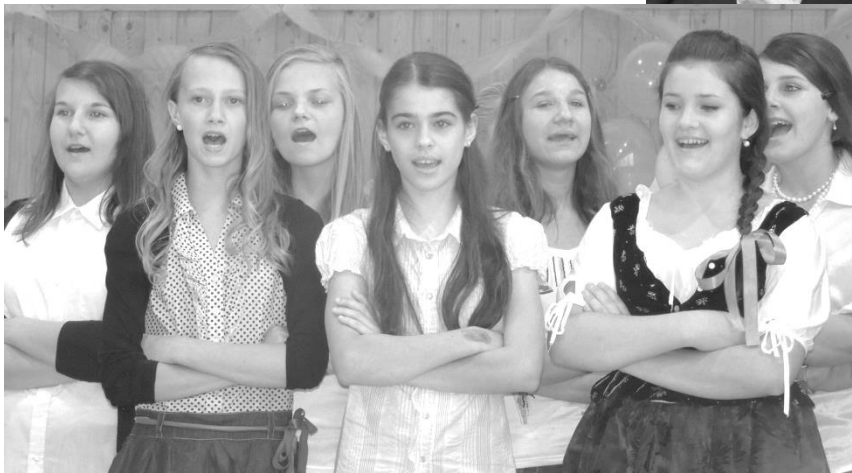
DEŇ MATIEK A OTCOV 2012/2013